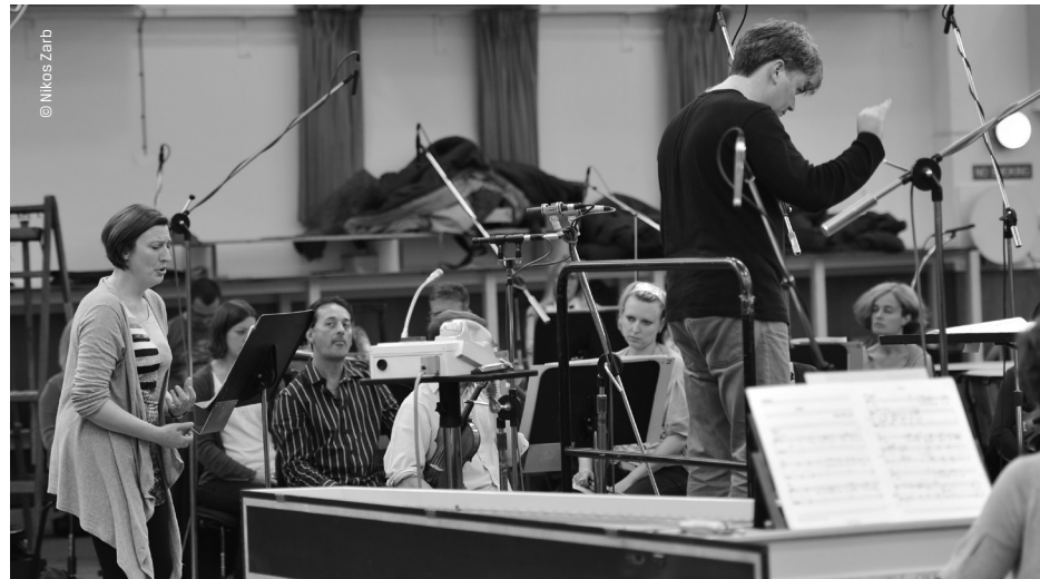
Sarah Connolly and Edward Gardner during the recording sessions