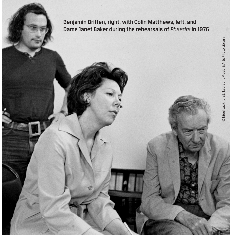
Benjamin Britten, right, with Colin Matthews, left, and Dame Janet Baker during the rehearsals of Phaedra in 1976