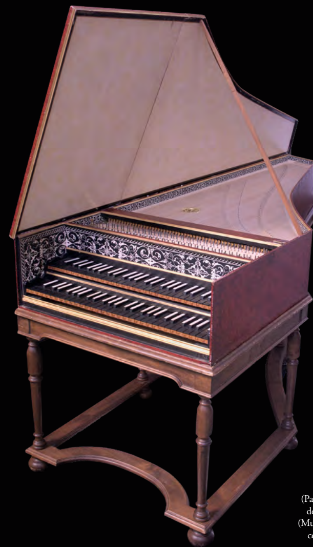
Clavecin franco-flamand de William F. Morton (Paris, 1991) d'après le clavecin de Iohannes Ruckers de 1624 (Musée Unterlinden de Colmar collection François Ryelandt, Bruxelles). ©François Ryelandt