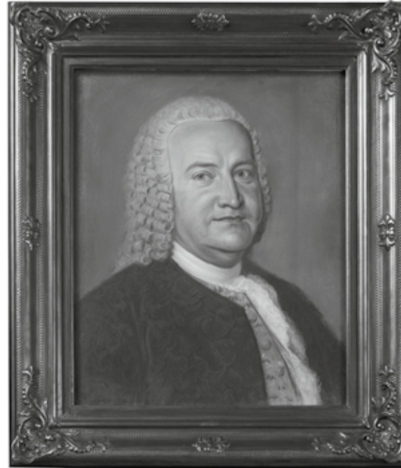
wahrscheinlich Johann Sebastian Bach Unbekannter Maler, Pastell 2014 entdeckt