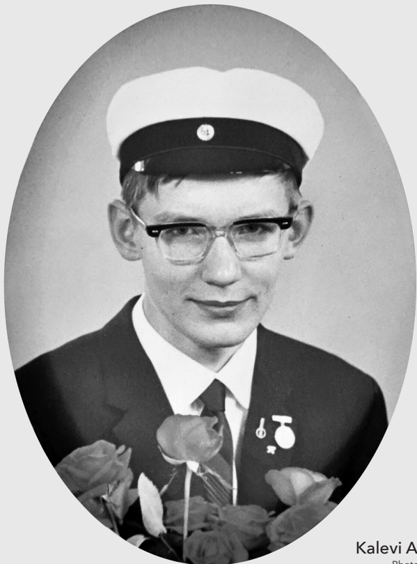
Kalevi Aho, 1968