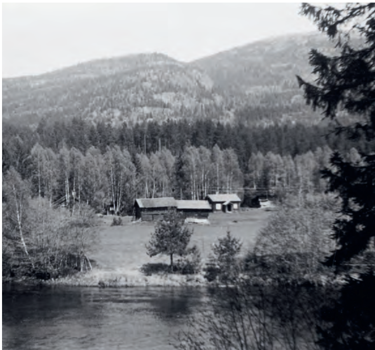
Raudmyr i Øvre Bø, 1950/1960