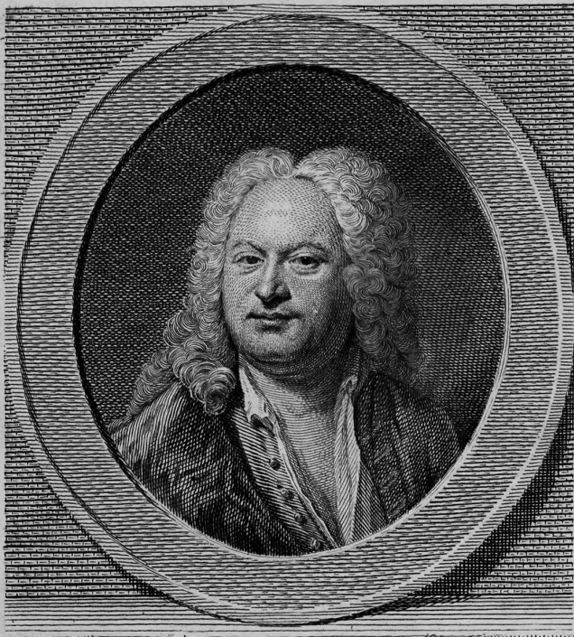
Copper engraving by Bartolomeo Follin, after a lost painting by Balthasar Denner