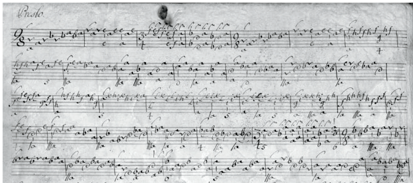
Presto, Sonata in G Minor, Dresden Manuscript Vol. 4, p. 56