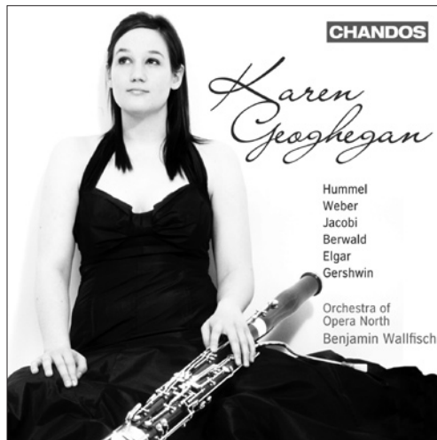
Karen Geoghegan Plays Works for Bassoon and Orchestra CHAN 10477