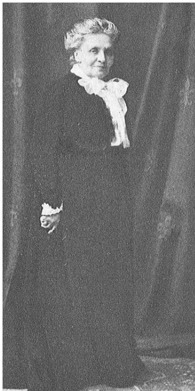
Elfrida Andrée, Vecko-Journalen No. 6, 1916

“Of these works, the most eagerly anticipated was undoubtedly a Symphony in C major by Miss Elfrida Andrée, who, a few years earlier, had gained public attention with a skillfully composed Quintet for Piano and Strings in E minor , published by the Musikaliska Konstföreningen. In many branches of the arts, women have already made notable contributions. [...] Her symphony belongs to the modern Romantic school and demonstrates her ability to handle the orchestra, although it sometimes feels unnecessarily demanding. The first two movements feature beautiful and well-developed motifs, especially the second movement, Intermezzo , a refined piece in both concept and execution. However, we found the Andante and Finale far less appealing.”