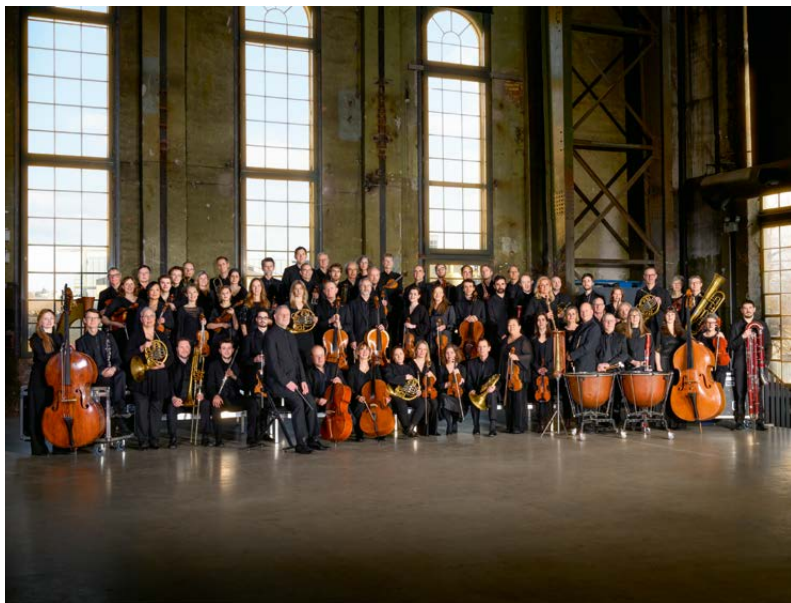
Norrköping Symphony Orchestra