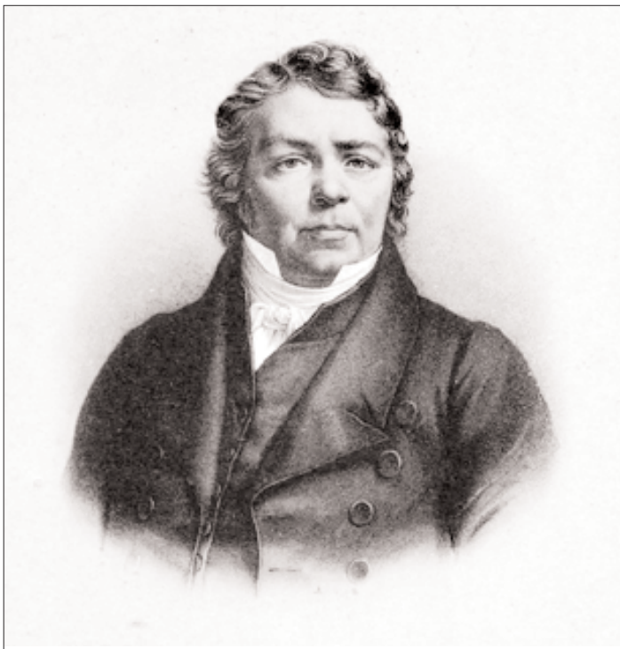
Johann Nepomuk Hummel