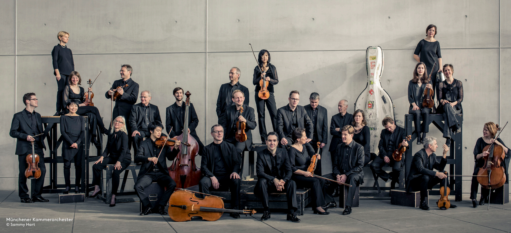
Münchener Kammerorchester