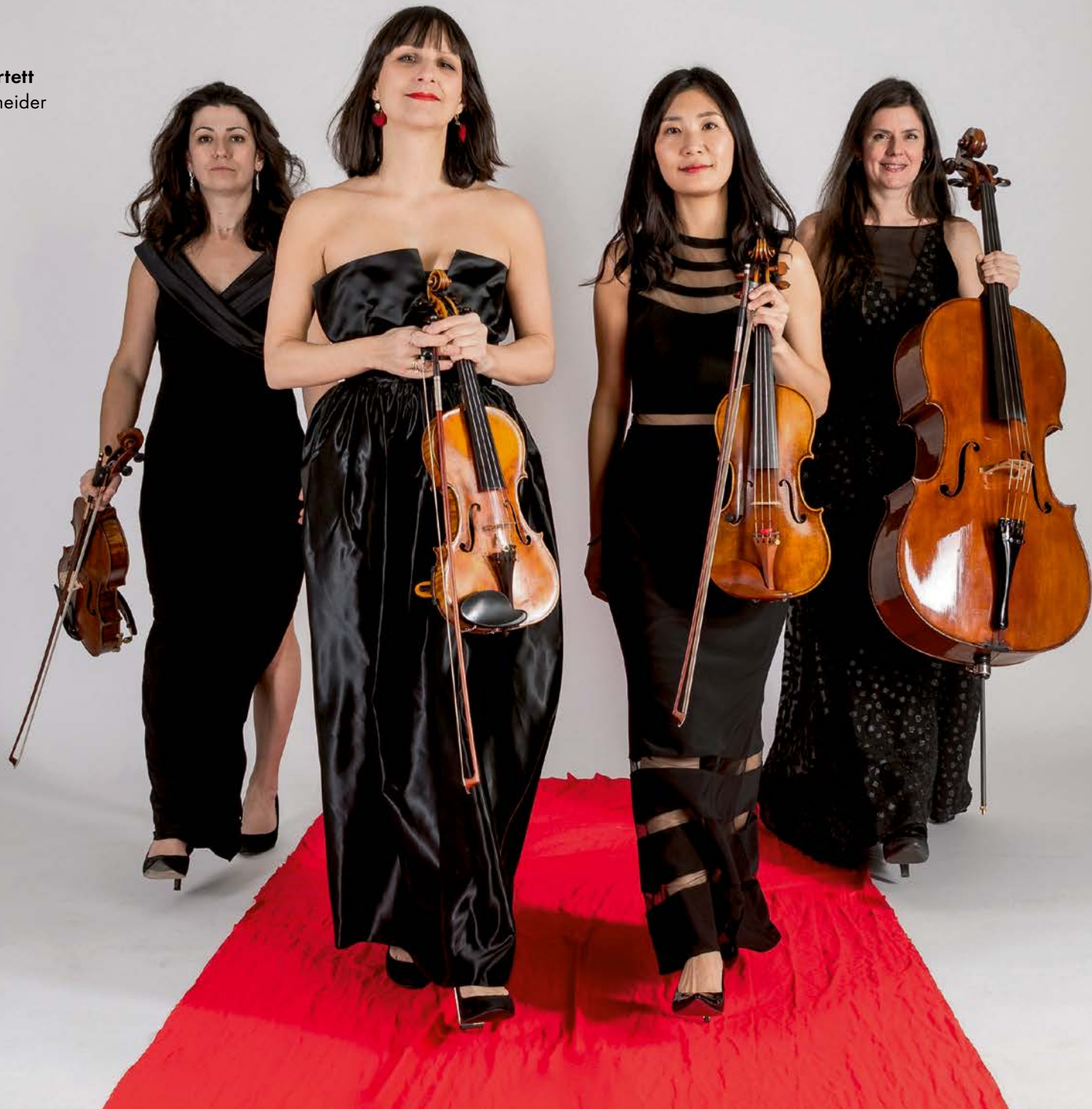
Constanze Quartett