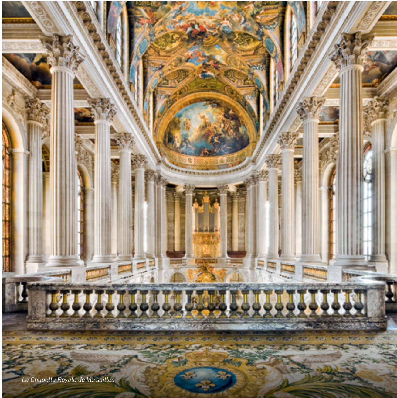
La Chapelle Royale de Versailles