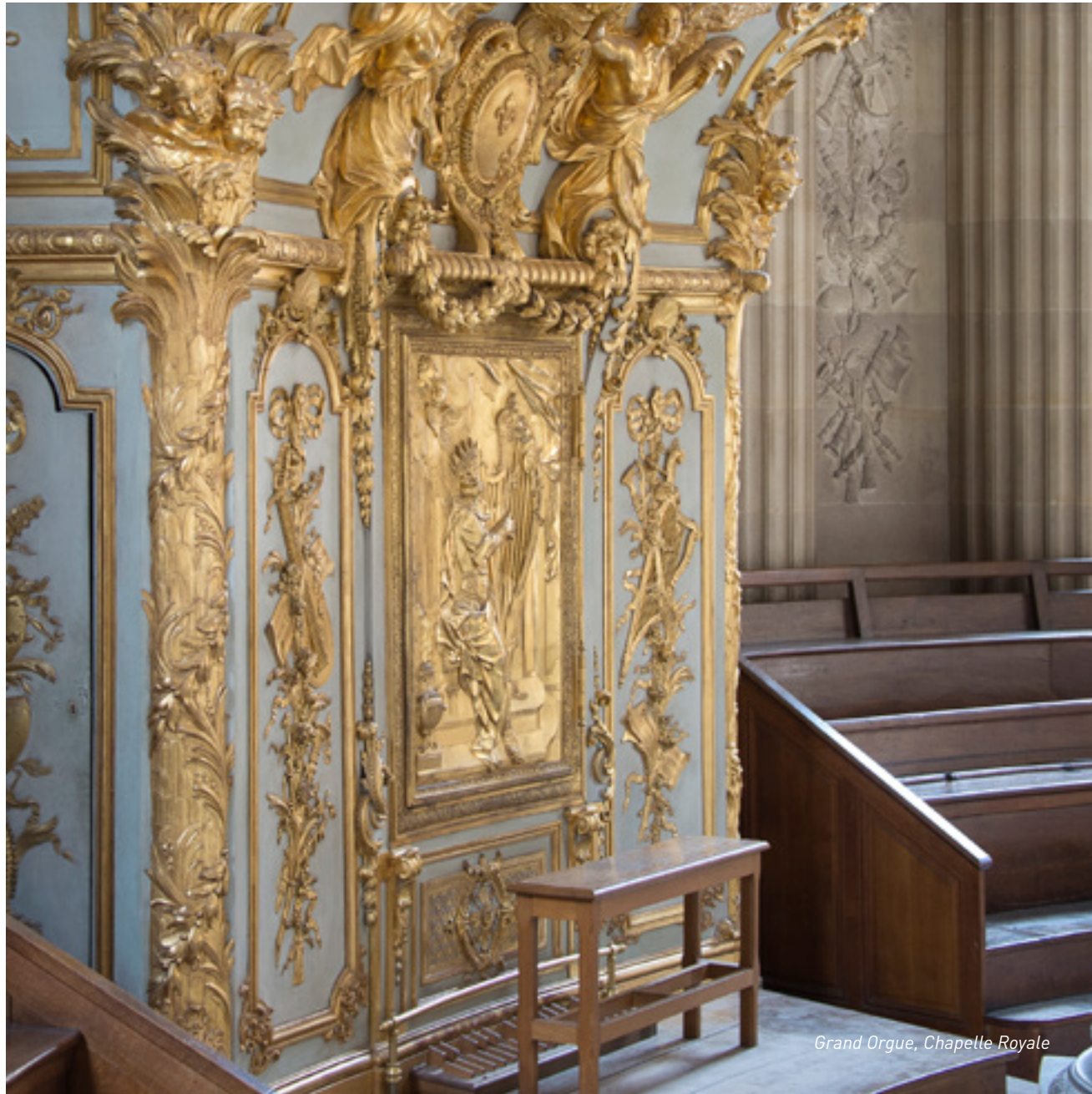
Grand Orgue, Chapelle Royale