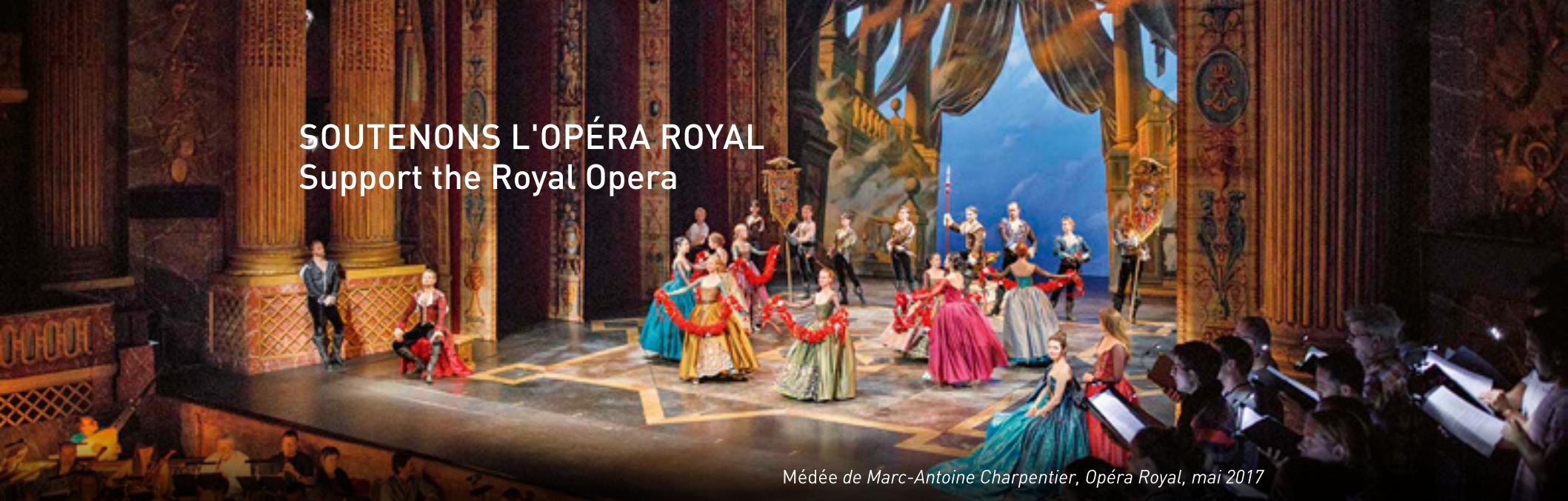
Médée de Marc-Antoine Charpentier, Opéra Royal, mai 2017

Château de Versailles Spectacles, filiale privée du Château de Versailles, a pour mission de perpétuer le foisonnement musical et artistique qui fait rayonner la résidence royale dans le monde entier. Elle produit la saison musicale de l'Opéra Royal, soit près d'une centaine de représentations par an à l'Opéra Royal et à la Chapelle Royale, des concerts d'exception au Salon d'Hercule et dans la Galerie des Glaces ainsi que les grands spectacles de plein air à l'Orangerie. Elle ne reçoit aucune subvention publique. Ses recettes de billetterie et le soutien de donateurs privés et d'entreprises mécènes lui permettent de construire une saison riche qui réunit plus de 50 000 spectateurs par an.