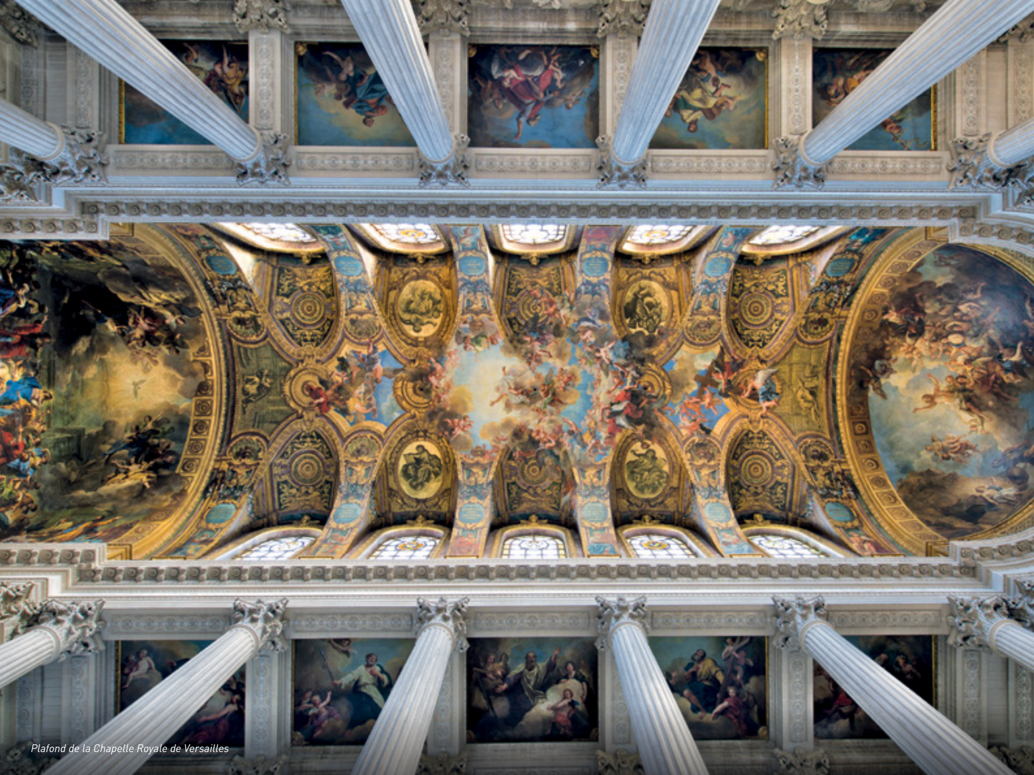
Plafond de la Chapelle Royale de Versailles