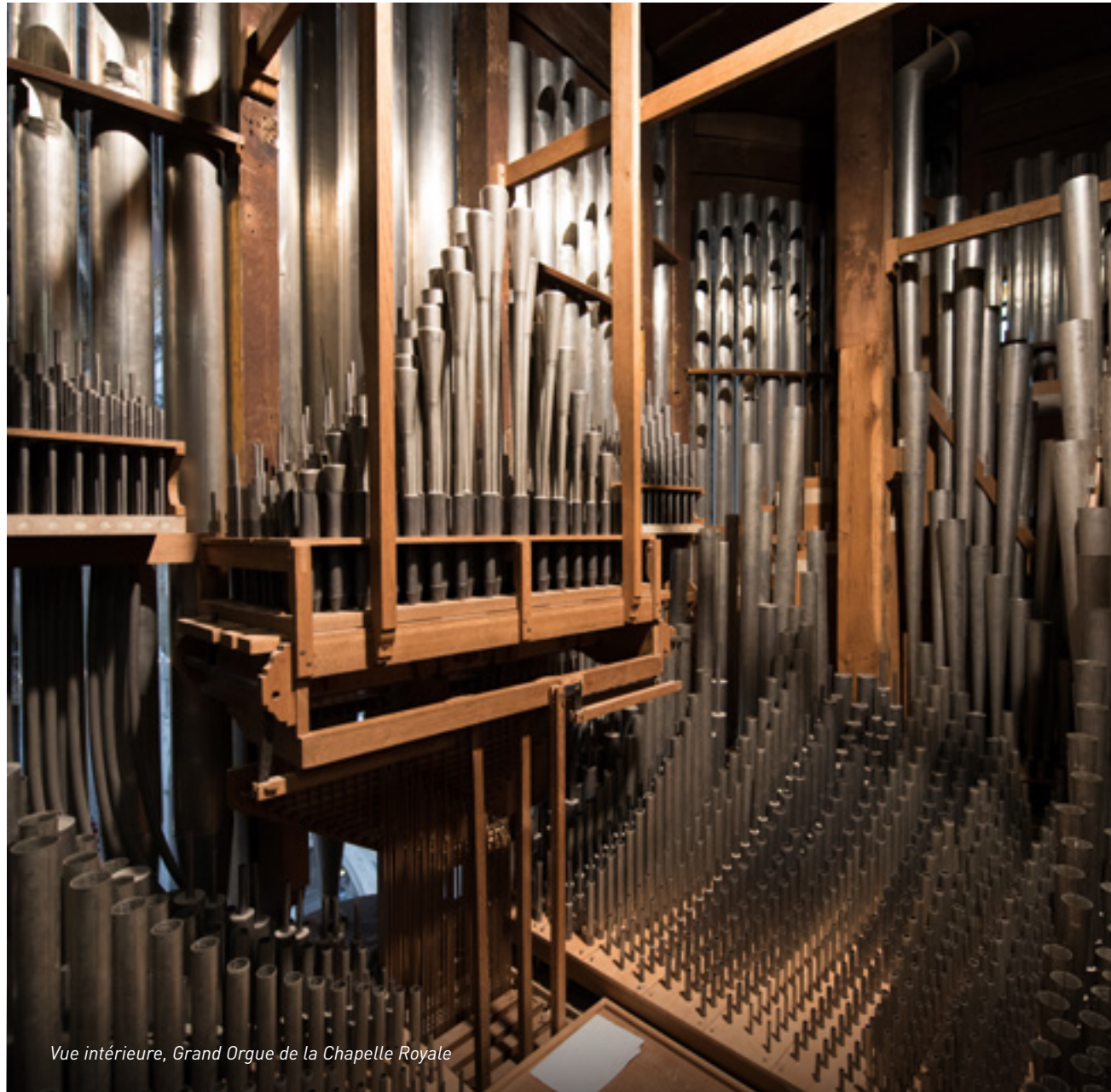
Vue intérieure, Grand Orgue de la Chapelle Royale