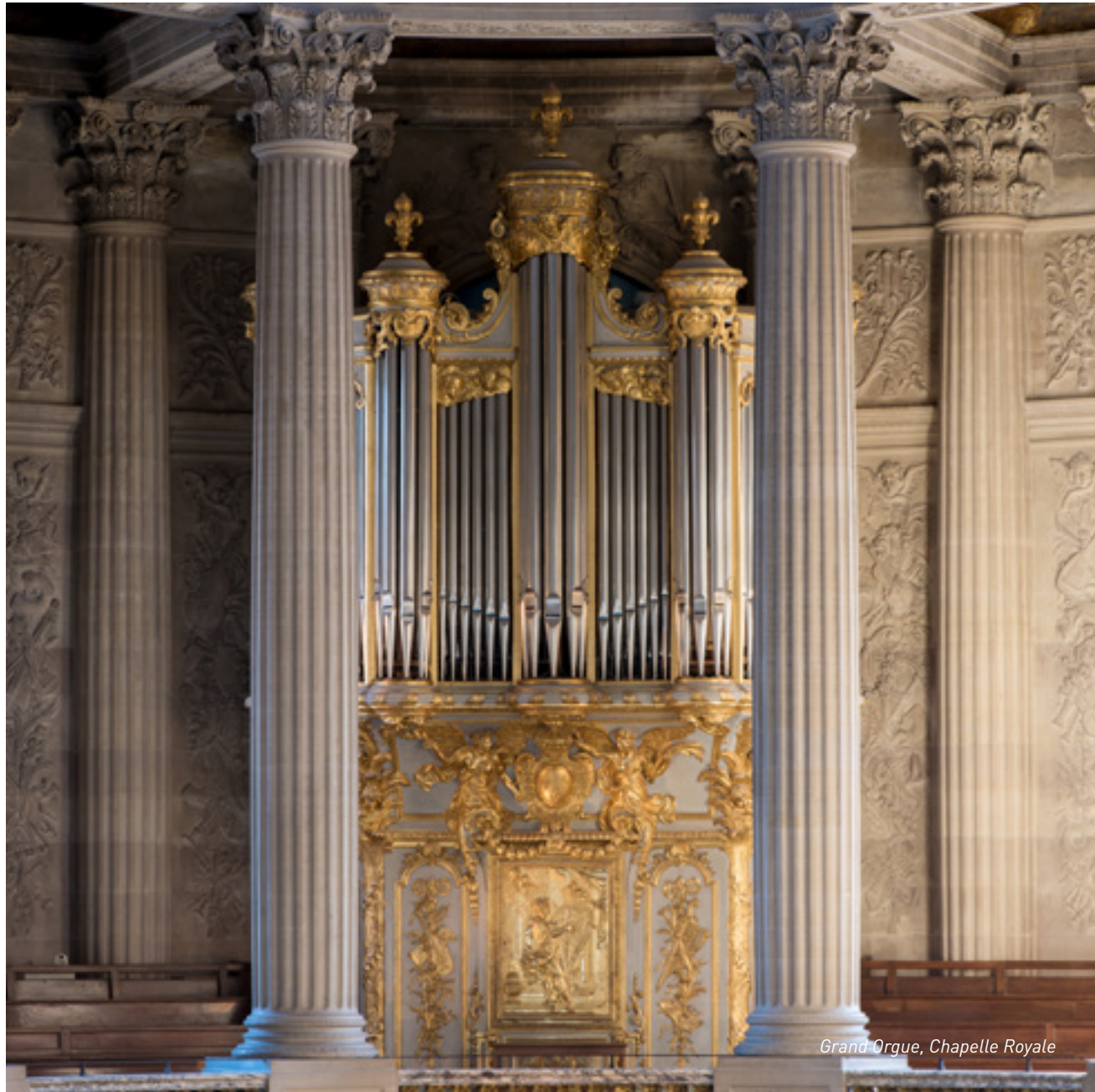
Grand Orgue, Chapelle Royale