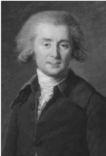
André Ernest Modeste Grétry by Élisabeth Vigée Le Brun

Her growing family hops, flutters, and essays flight around her, Gathered under her wing; her heart as yet delights in their love for her. But as misfortune would have it, the bird hunters come, which robs her of her hope, the poor mother! She thinks of nothing but her misfortune. Everything resounds with her grief.