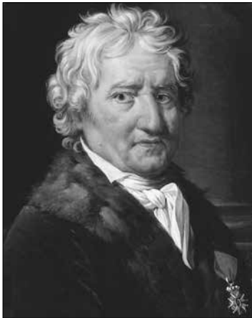
Pierre-Alexandre Monsigny by Robert Lefèvre

Living and loving you are for me one and the same thing,