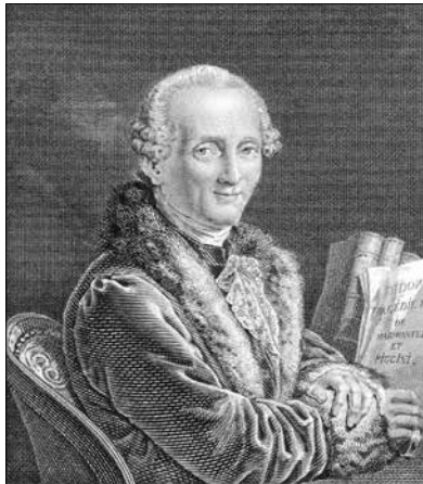
Niccolò Piccinni (1728-1800) by Hippolyte Pauquet

Since I'm a turtledove far from the nest, Since I love you and entrust myself to your good heart, Since if it happens that you don't have modest eyes, You'll see me die of too much grief.