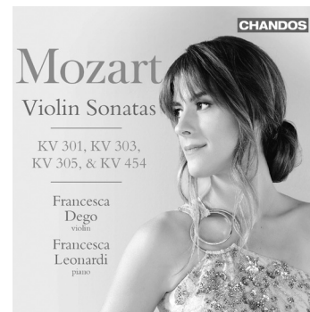
Mozart Violin Sonatas CHAN 20232