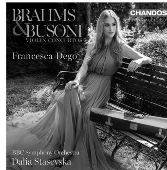
Brahms • Busoni Violin Concertos CHSA 5333