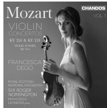
Mozart Violin Concertos • Violin Sonata CHAN 20234