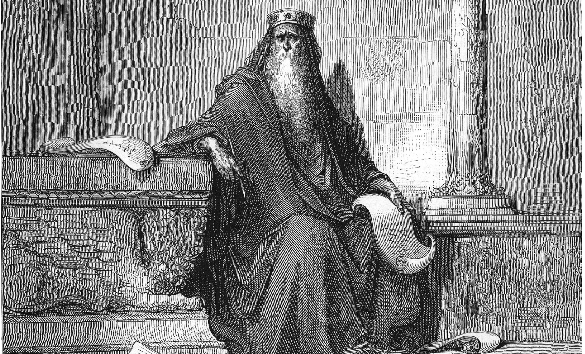
Detail of King Solomon engraving by Gustave Doré, 1866