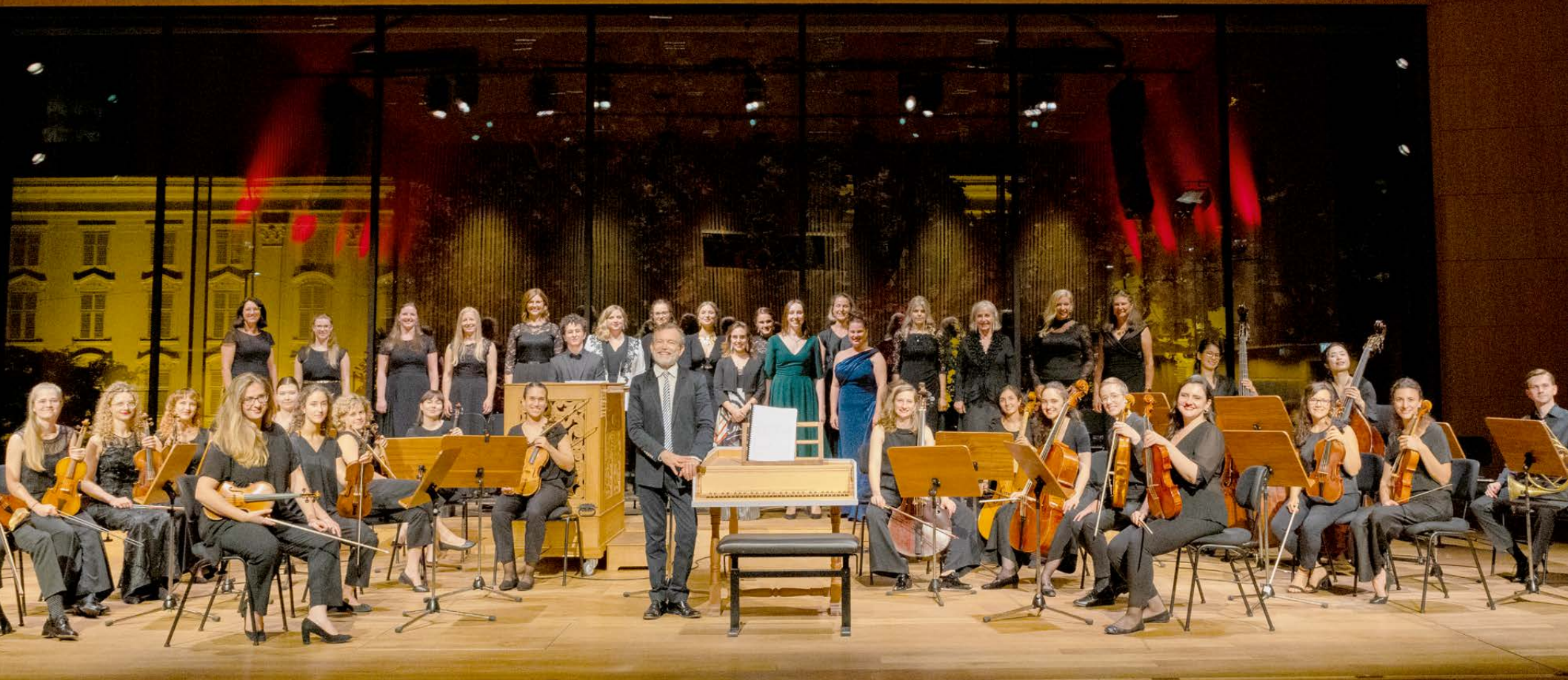
Soloists, NovoCanto, Theresia Orchestra and Christophe Rousset in Innsbruck