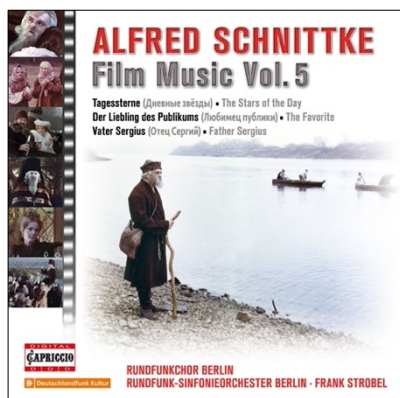
ALFRED SCHNITTKKE FILM MUSIC - Vol. 5 C5350 · 1CD · PC: 21