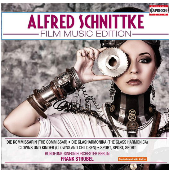
ALFRED SCHNITTKKE FILM MUSIC EDITION Vol. 1-4 C7196 · 4CD-Box · PC: 04