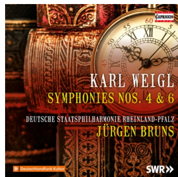
KARL WEIGL Symphonies Nos. 4 & 6 C5385