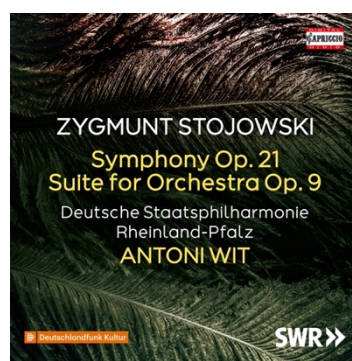
ZYGMUNT STOJOWSKI Symphony OP. 21 Suite for Orchestra Op. 9 C5464