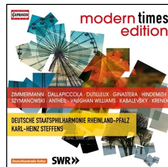
MODERN TIMES EDITION Ginastera · Antheil · Dutilleux a.o. 10CD-Set · C7337