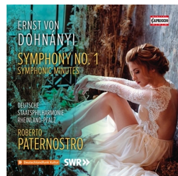
ERNŐ DOHNANYI Symphony No. 1 C5386