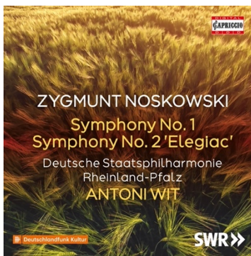
ZYGMUNT NOSKOWSKI Symphonies Nos. 1 & 2 C5509