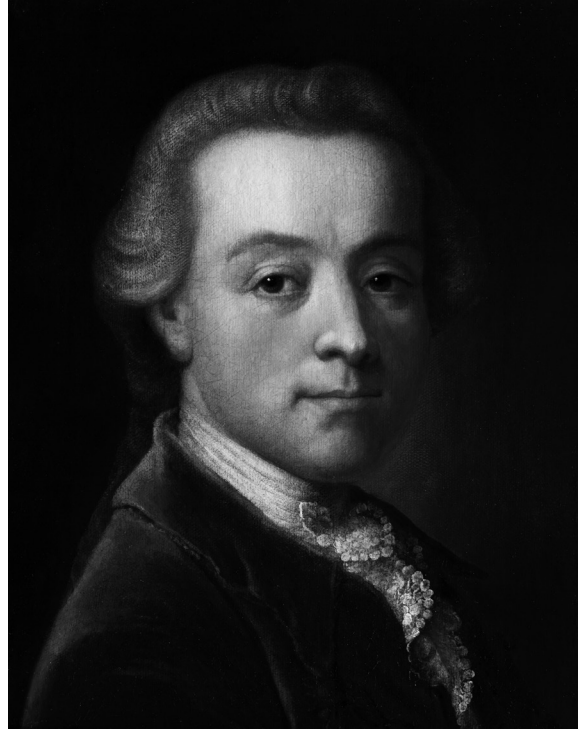
Wolfgang Amadeus Mozart, c. 1789

Portrait by an anonymous artist, now in a private collection