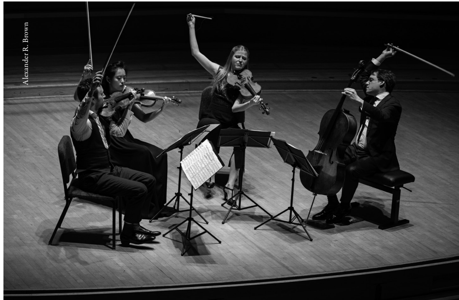
Doric String Quartet in performance at the Perelman Theater, Kimmel Center, in Philadelphia, Pennsylvania, at a concert in February 2020 promoted by the Philadelphia Chamber Music Society