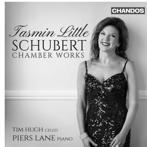
Schubert Chamber Works CHAN 10850(2)