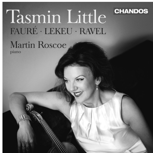
Fauré · Lekeu · Ravel Violin Sonatas CHAN 10812