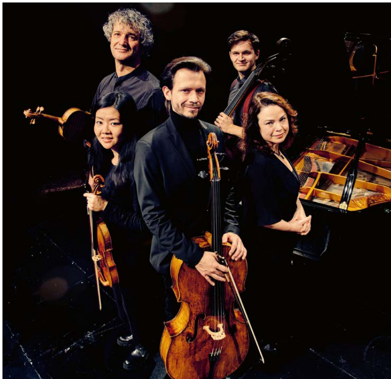
Ensemble Louise Farrenc