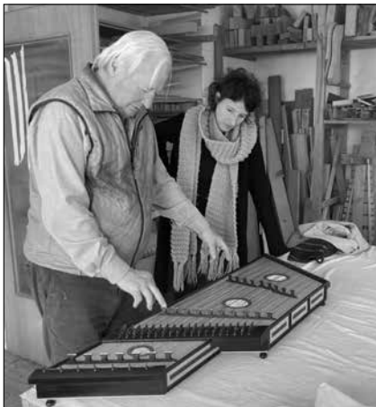
... at the instrument maker's

Bramo un core che impari dal mio tenerezza e costanza in amar Fè per fè cor per core io desio Che non voglia e non possa cangiar.