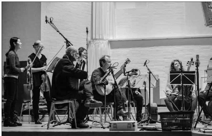
... at the recording session (© LUX Studio Productions)