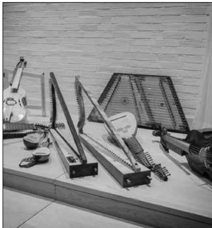
Concerthall Reitstadel, Neumarkt/Oberpfalz