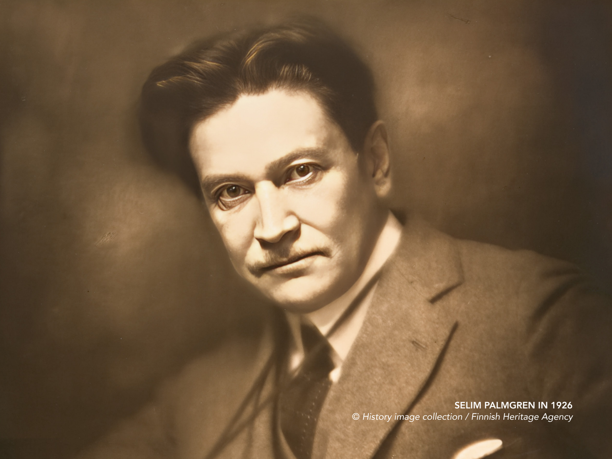
SELIM PALMGREN IN 1926