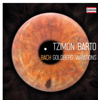
Johann Sebastian Bach Goldberg Variations 1CD · C5243