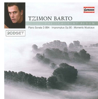
Franz Schubert Impromptus · Moment musicaux 2CD · C5028