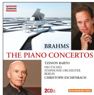
Johannes Brahms The Piano Concertos 2CD · C5386