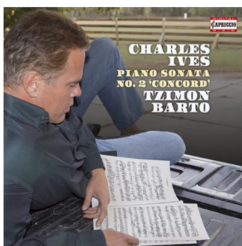
Charles Ives Sonata No. 2 'Concord Sonata' 1CD · C5268