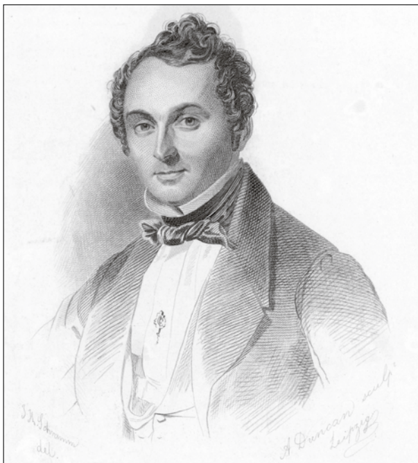
Albert Lortzing (um 1835, Stich nach Johann Heinrich Schramm)