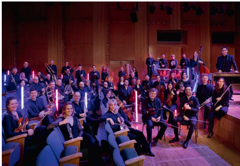
WDR Funkhausorchester