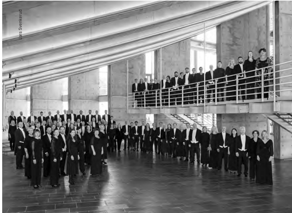
Bergen Philharmonic Orchestra, in the foyer at Grieghallen, Bergen