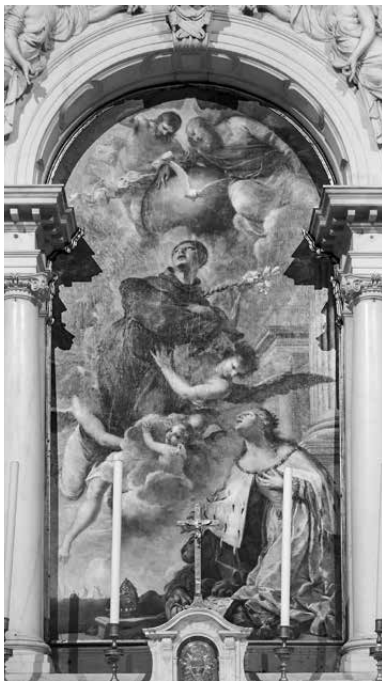
Santa Maria della Salute, “Venice at the feet of St. Anthony of Padua” by Pietro Liberi (1605–1687)