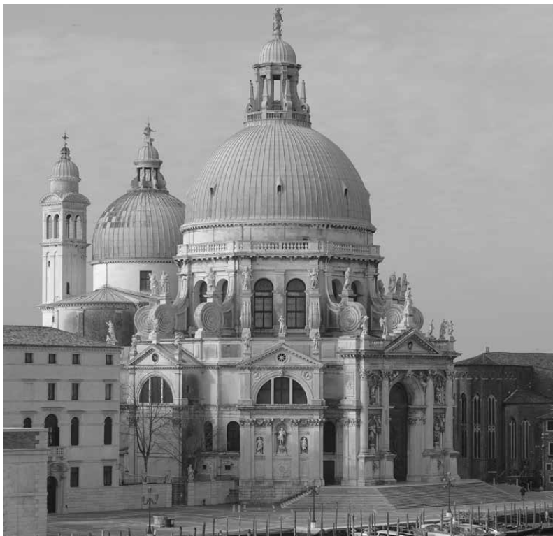
Santa Maria della Salute