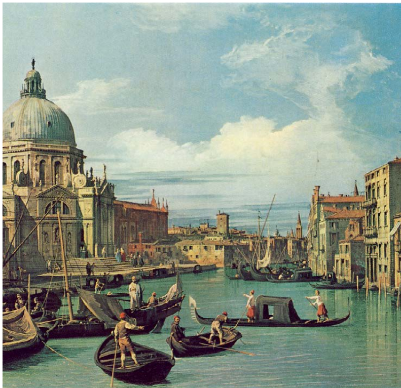
The Entrance to the Grand Canal, Venice (Canaletto, 1697-1768)