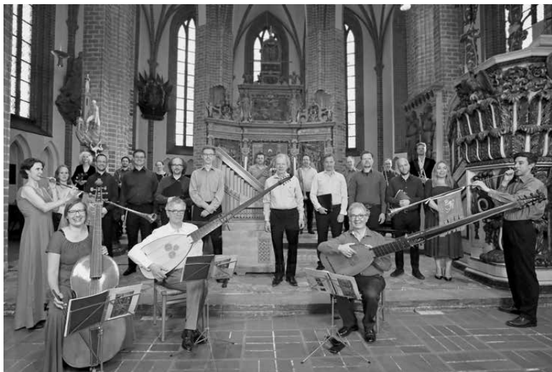
La Capella Ducale · Roland Wilson · Musica Fiata